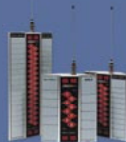
Základnové stanice pro připojení 8, 16, 32 pagerů